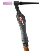
ST26 PRO-P 4M AX50 8P ГОРЕЛКА ТИГ 743033