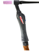
ST26 PRO-C 4M AX50 8P ГОРЕЛКА ТИГ 743037