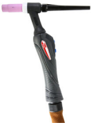
ST26 PRO-C 8M AX50 8P ГОРЕЛКА ТИГ 743039