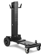
ТЕЛЕЖКА - UNIVERSAL 803092