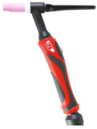
ST26 8M AX50 8P ГОРЕЛКА ТИГ 743127